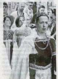
Un momento della sfilata

●●● Continua a Erice vettura "FedEricina". Dalle 16 presso il Castello Torre del Balio rimarrà aperto il Villaggio Medievale con la partecipazione di mercanti, artigiani, suoni, giochi fanciuleschi, l'accampamento militare con i Cavalieri della Torre - Stella del Vespro di Enna. Alle 16.30 sfilata del gruppo dei musici e dei tamburi "Real Trinacria", dei Reali, dei Vessilli, dei Cavalieri e dei popolani. Alle 18.30 in piazza Loggia duello cortese tra i cavalieri, in onore di Re Federico III d'Aragona. A conclusione proclamazione del vincitore. (*MAX*)